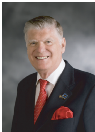
国際ロータリー会長 ジョン・ケニー氏より、 ガバナーにメッセージが 届いておりますので、紹 介いたします。